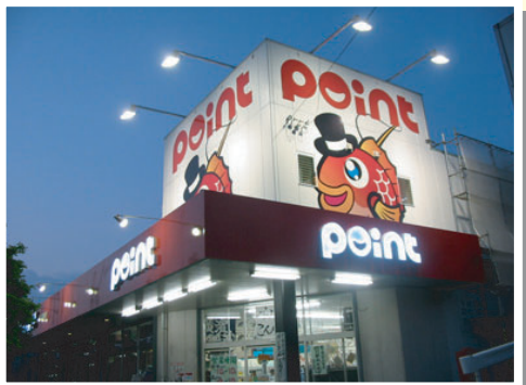
ポイント横浜港南台店様

A-1 塔屋看板 ：大型店舗向きの存在感のある看板です。鉄道沿線なら乗客にもアピールできます。