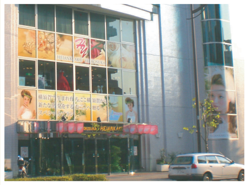
よこすか平安閣様