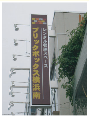
ブリックボックス横浜南店様