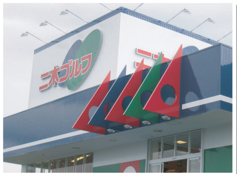
ニ木ゴルフつくば学園店様