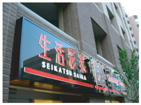
生活彩家馬喰町店様

C-1ランマ看板 ：店舗入口上部に設置します。まさにお店の顔とも言え、これがないと入りづらい場合もあります。