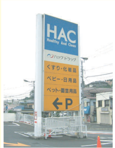
ハックドラッグ市沢店様