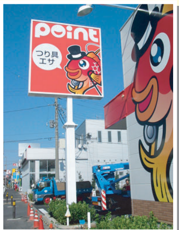
ポイント藤沢長後店様

幹線道路に面した路面店に向いています。特に前面駐車場などで道路から建物が見えにくい時に有効です。駐車場への誘導サインとしての機能もあります。