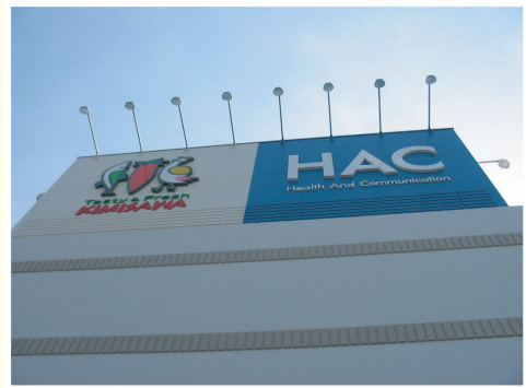
ハックドラッグ/キミサワ港南台SC店様