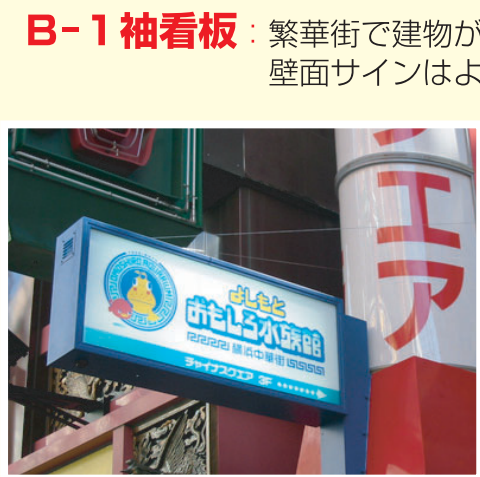
よしとおもしろ水族館様