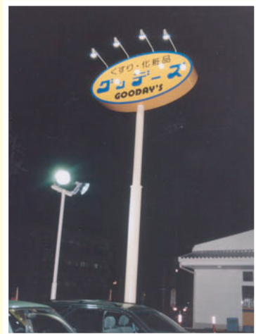
グッデーズ忠生店様