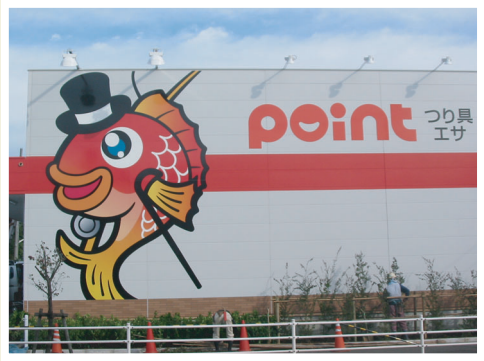
ポイント藤沢長後店様

B-2壁面グラフィック ：楽しさ・華やかさを演出するならこれ。 (ウィンドウ) 大きな写真やイラストは注目度抜群です。